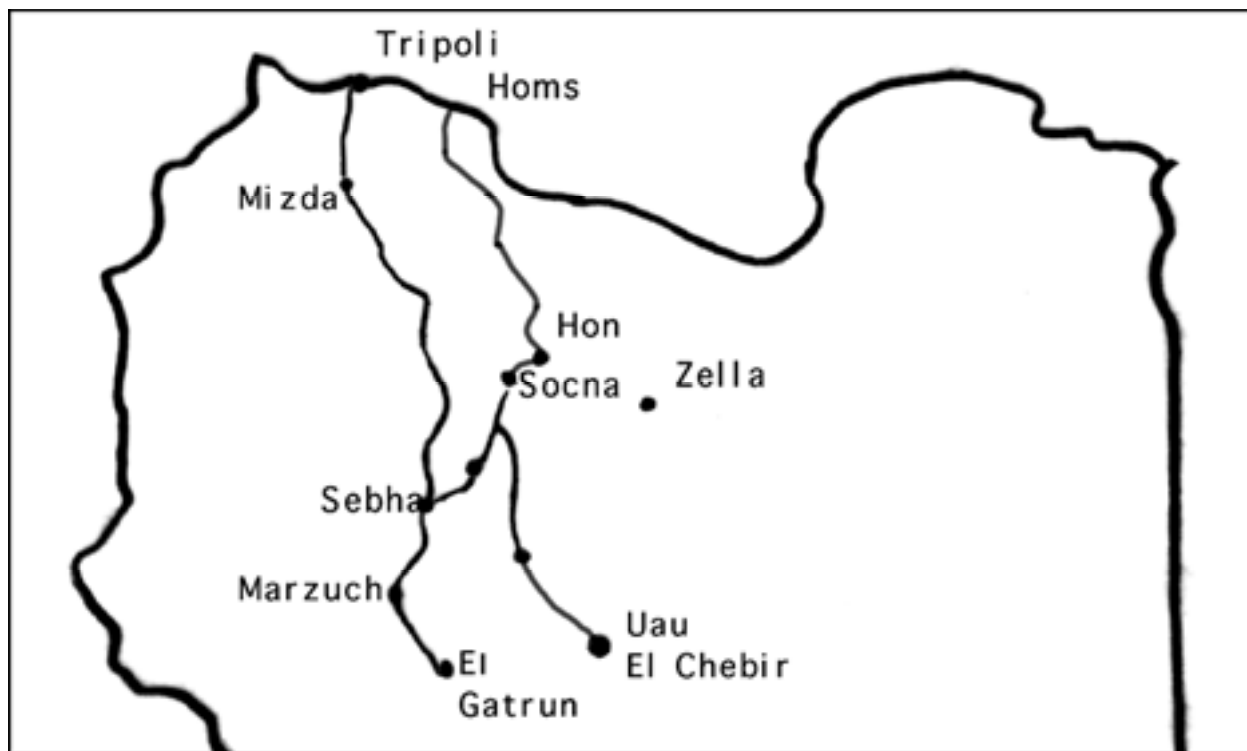
Ripiegamento del Presidio di Sebha con il 2° squadrone carri in retroguardia

che infaticabilmente percorreva la colonna dalla testa alla coda, di tutto occupandosi e provvedendo ed in più d'una occasione fu di prezioso aiuto allo stesso comandante di squadrone il cui automezzo spesso s'arrendeva alle asperità del percorso.