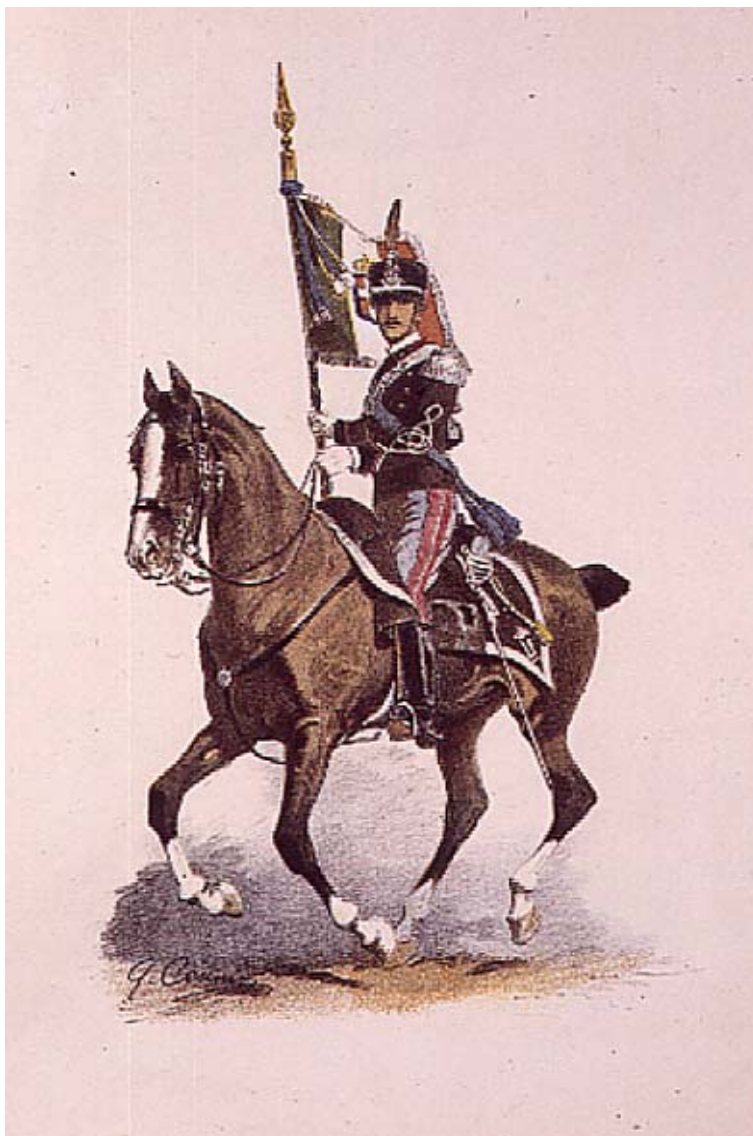
Quinto Cenni: Stendardo di Lodi