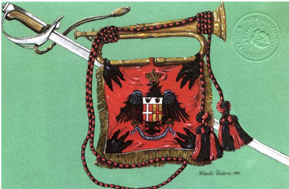
A. Parducci: Allegoria per i 70 anni dello Stemma araldico - Cartolina reggimentale

ed i soggetti “africani”, che lavorerà per “Lodi” ininterrottamente per quasi tre lustri e perfino dopo il suo ultimo scioglimento.