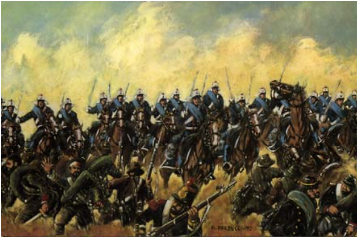
A. Parducci: La carica di Canestrelli Ofanto - Calendario e cartolina reggimentale

utilizzarla con un notevole vigore che gli viene dal dentro ma che è ben <<mescolato>> ad una tecnica affinata e condotto con mano felice.