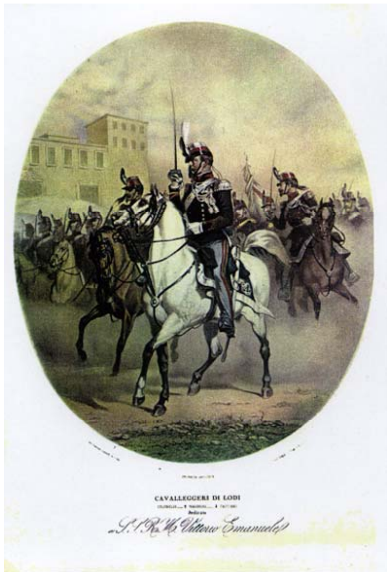
Parata - Calendario e cartolina