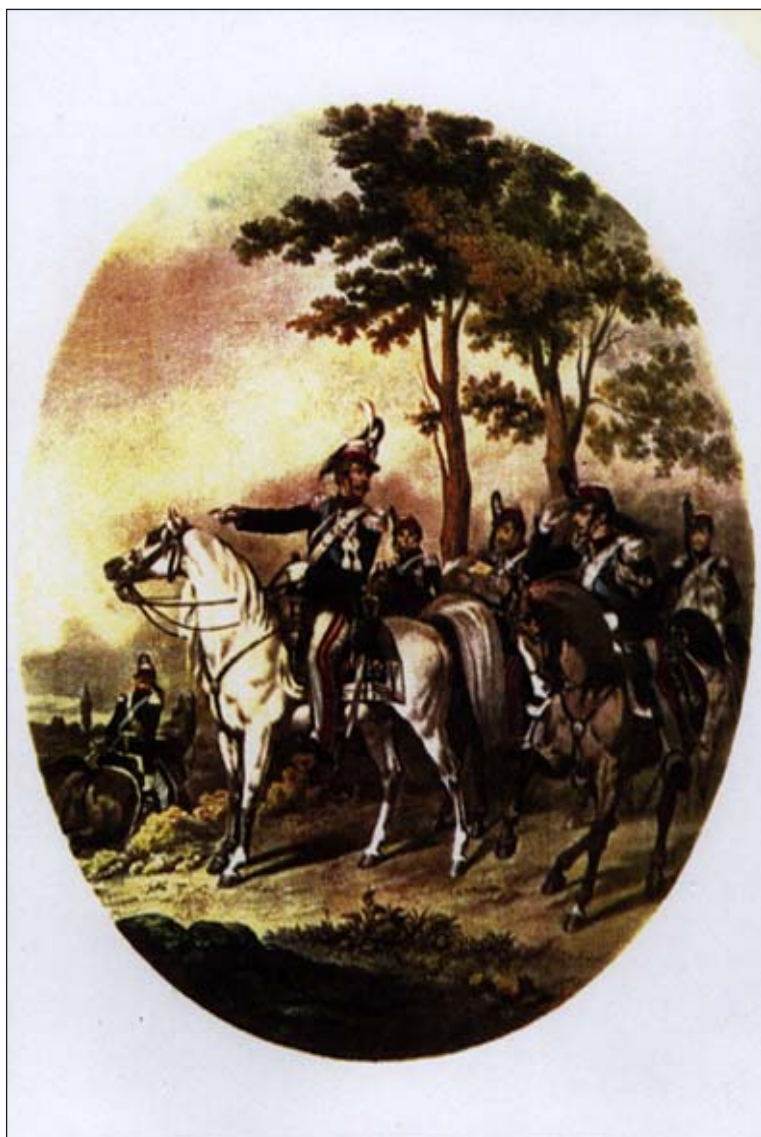
Il Comandante ed il suo Stato Maggiore alle porte di Roma Cartolina reggimentale