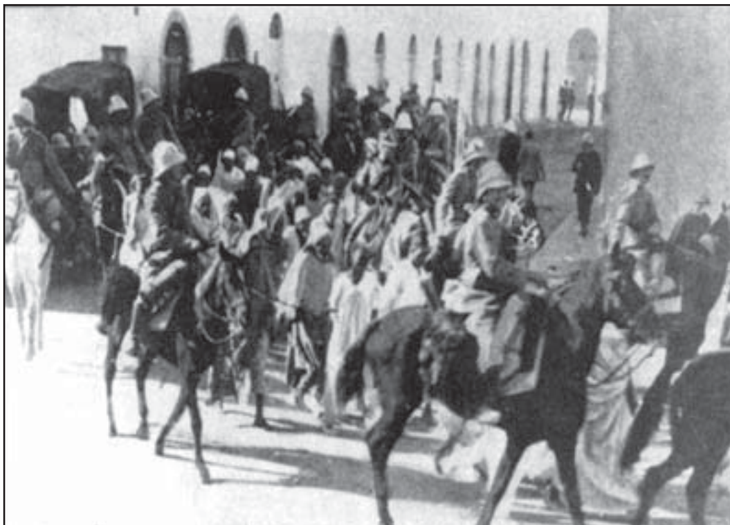
Trasferimento di prigionieri arabi

uomini circa) defezionano, mentre i fedelissimi Eritrei si battono come leoni e le nostre artiglierie spazzano il terreno con alzo zero.