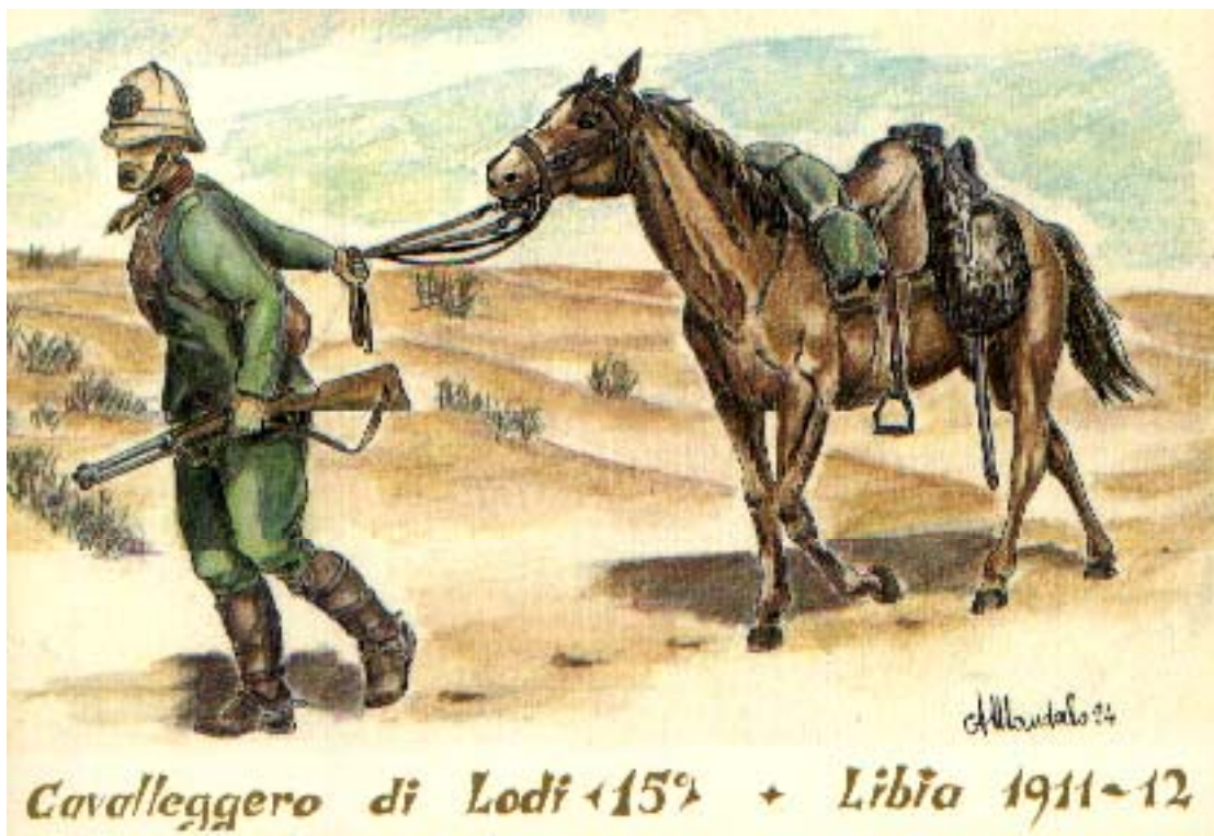
Acquerello di A. Mandorlo nel 135° del Reggimento - Ed. Publicard - Torino

Dopo quattro ore di marcia, il grosso, affaticato da un caldissimo ghibli che soffia senza posa, sosta sul Wâdî Bû Sceba, mentre pattuglie di cavalieri si spingono tra Ayn Ogla e le Rabte per stabilire il collegamento con l'82° fanteria, cui è affidato il concorso all'azione della Colonna.