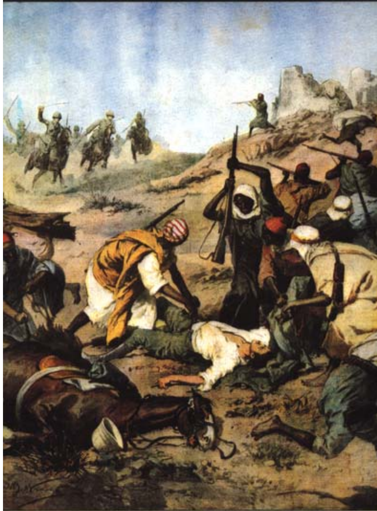
Epiuodo di valore attorno ad un caporale dei Cavalleggeri Lodi caduto ferito e spogliato dagli arabi ma alla fine liberato dai nostri. (Disegno di A. BIGNARDI)