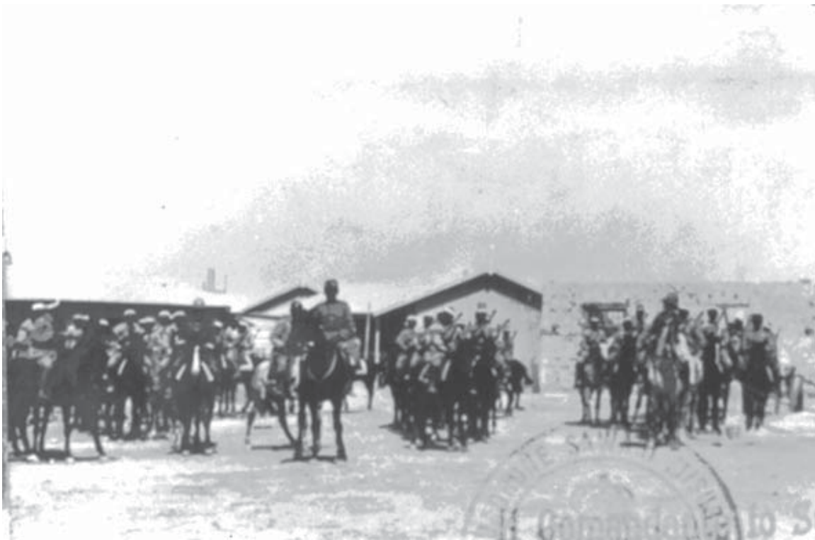
Lo squadrone Savari

che, proveniente da Tebedut, avrebbe dovuto riunirsi alla Colonna, per l'attacco alle oasi. Ormai in vista dell'obiettivo e nonostante gli esploratori gli segnalino un nuovo considerevole concentramento nemico verso Bir Al Ghnem, il Comandante attende ancora fino alle 16,30 e, quindi approssimandosi le tenebre, senz'acqua e con le munizioni quasi esaurite, deve rassegnarsi ad ordinare il rientro alle basi di partenza.