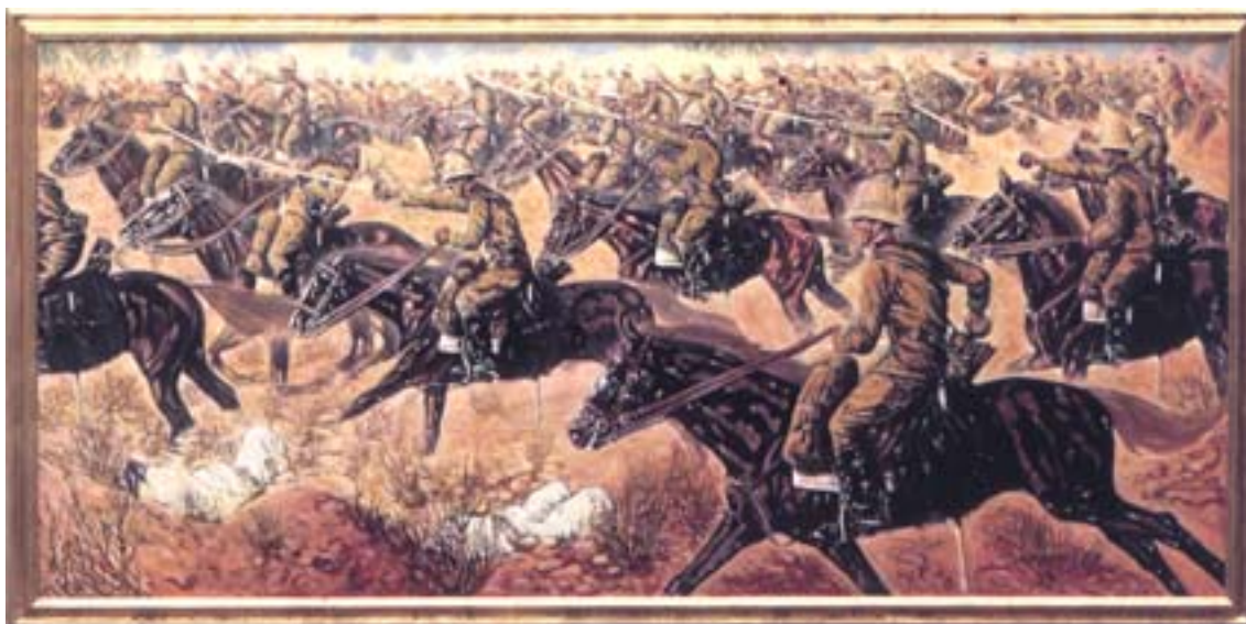
A. Parducci: Carica di Monterus Nero

Il terreno in cui i nostri sono chiamati ad operare è quello delimitato a nord, dalla regione di Al'Aziziyah; a sud, dalle estreme pendici del Jebel Gharyan e precisamente dalle alture del Monterus Nero e del Monterus Bianco; ad est, dallo sperone montano che dal Jebel si protende verso Al'Aziziyah attraversato nel senso della lunghezza dalla strada che collega quella città a Gharyan, passando per Bû Gaylân; ed ad ovest, infine, dalle pietraie della piana di Gattis.